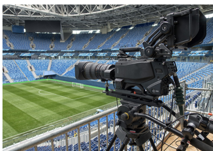
COULEUR DU MÉLANGE